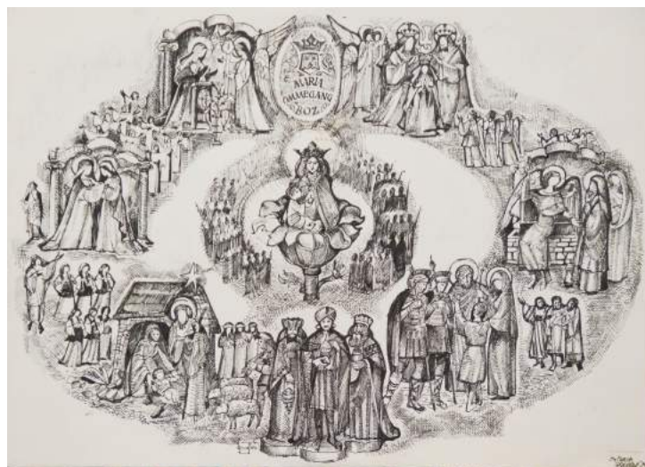
Ontwerp schetsen van elementen (boven) voor het uitendelijk ontwerp (onder) voor de dankbetuiging waarin de Bergenaren in verschillende groepen van de Ommegang rondom Maria trekken.

Omdat vele deelnemers in de loop van de jaren trouwe deelnemers bleken, werd op zeker moment gezocht naar een passende dank voor mensen die al 25 jaar aan de Ommegang deelnamen. Door Fons Gieles werd daarvoor in 1975 de onderstaande tekening gemaakt.