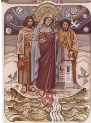
Centrale deel van een groot olieverfschilderij waarin St Gertrudis is afgebeeld.

zijn schilderij dat hij maakte in opdracht van Pierre van Giels waarin vele Bergse elementen afgebeeld zijn rondom St Gertrudis met het stadswapen van Beregen op Zoom.