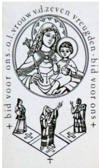
Het bidprentje bij het overlijden van dhr. Quick

Jarenlang is Cees Quick de drijvende kracht geweest achter de Ommegang en was er een goede verstandhouding met Fons Gieles. Toen Cees Quick overleed was het dan ook niet verrassend dat het bidprentje, door Fons Gieles ontworpen, de Ommegang als thema bevatte.