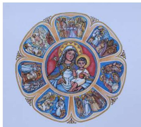
De Zeven Vreugden van Maria, zwart-wit en in kleur.